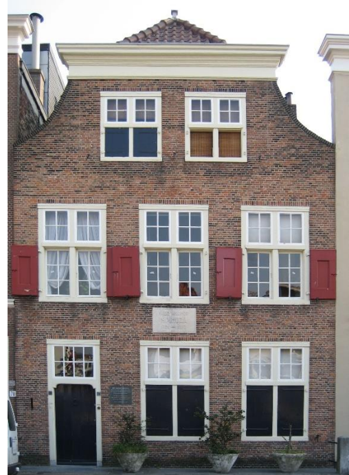
Het Spinozahuis, het oudste bezit van de stichting.

Het bestuur is de donateurs van de stichting erkentelijk voor hun jaarlijkse bijdragen. Mede dankzij giften, erfenissen en legaten blijft het mogelijk kostbaar Haags erfgoed te behouden.